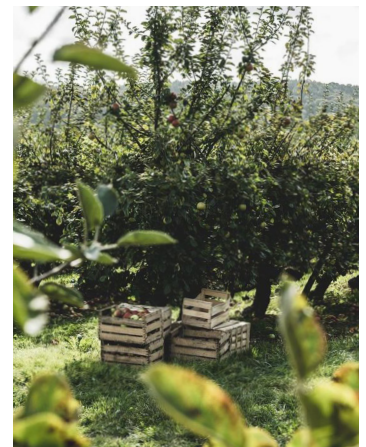
Verger, espace de convivialité