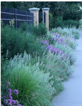
Massif étagé, filtre végétal