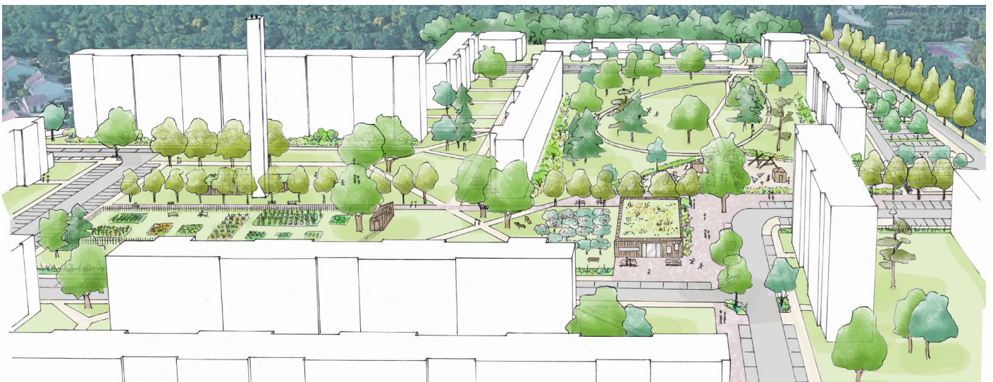
Le désenclavement du quartier passe par la création d'un parc urbain ouvert sur la ville