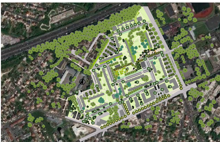
Plan du scénario retenu