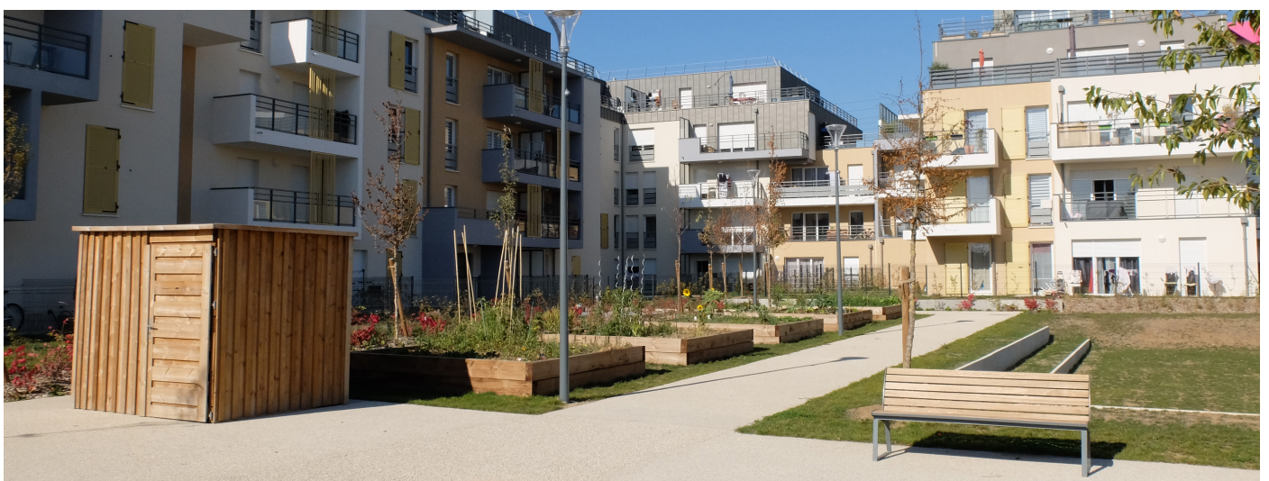
Coeur d'îlot vivant avec placette, mobilier et carrés potagers