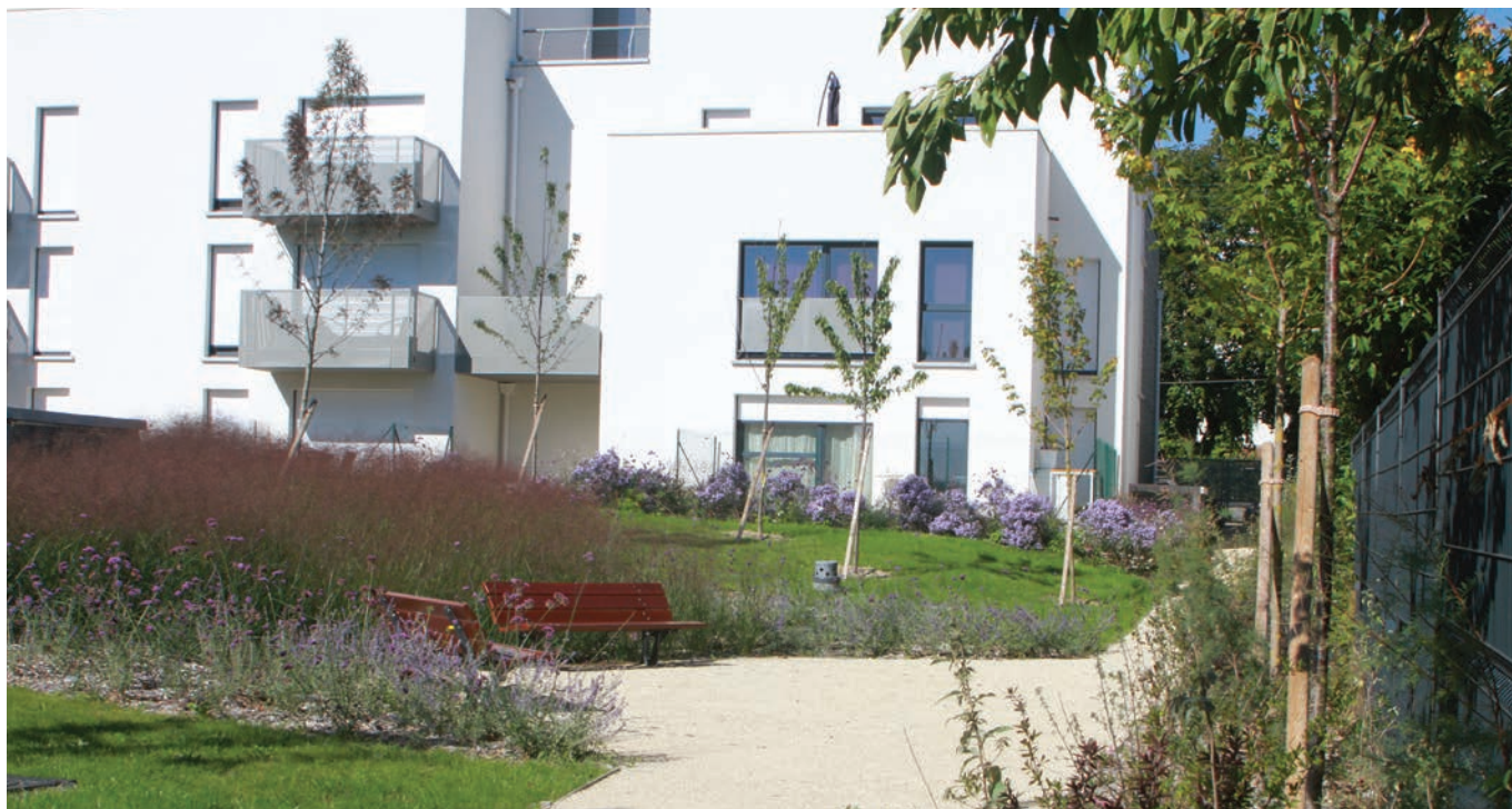
Massif de graminées au centre du jardin avec des tonalités de rose

Aménagement paysager autour de 62 logements et d'une salle polyvalente